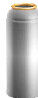
1 inch Rillenschulter / Rim shoulder